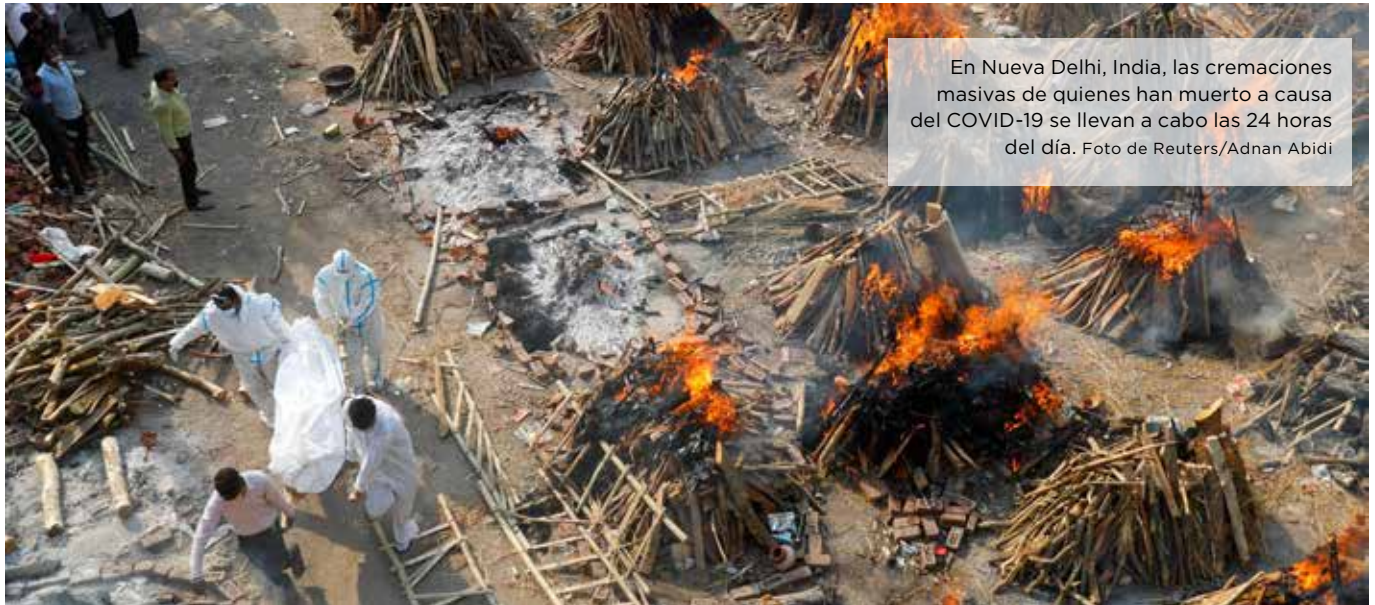
En Nueva Delhi, India, las cremaciones masivas de quienes han muerto a causa del COVID-19 se llevan a cabo las 24 horas del día.

Catholic Relief Services y nuestros socios en todo el mundo están apoyando a las comunidades de alto riesgo en la primera línea de la pandemia de COVID-19. Mientras tanto, nuestros programas humanitarios y de desarrollo críticos continúan. Lee los aspectos más destacados de las respuestas de emergencia de CRS y nuestros socios.